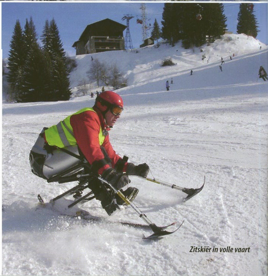
Zitskiër in volle vaart