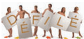
Modeshow t.v.v. Anvasport op 6 oktober in zaal Gowalt