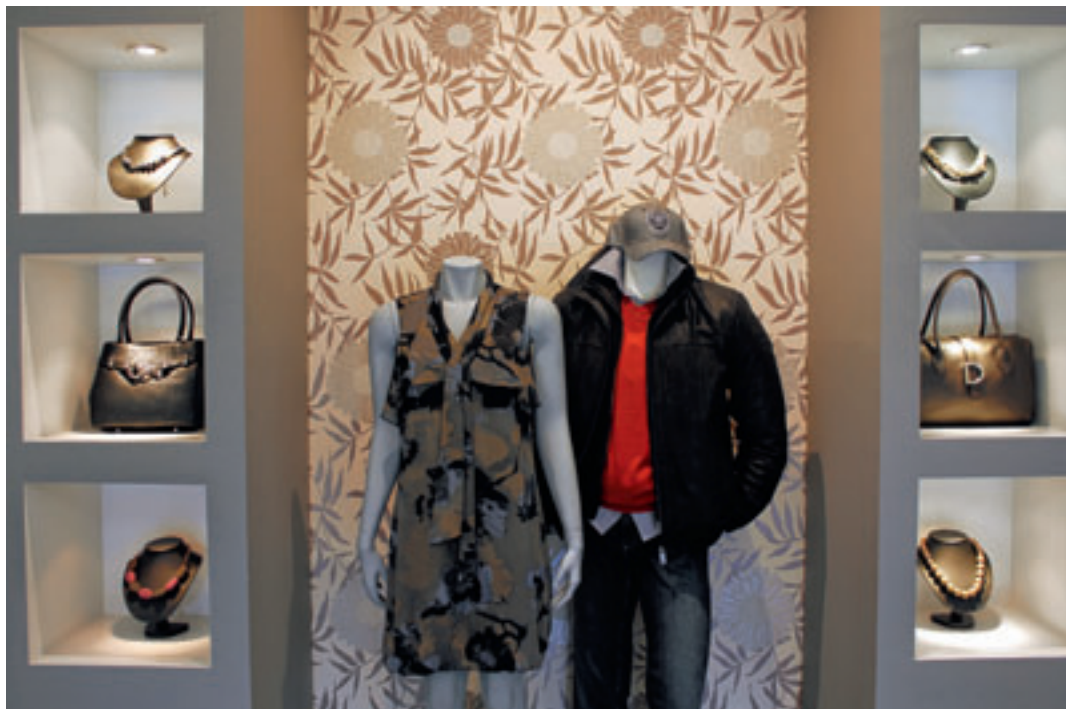
Wetterse handelaars organiseren Défilé, een modeshow t.v.v. Anvasport.

Op 6 oktober slaan enkele winkels in het centrum van Wetteren twee vliegen in één klap. Met Défilé showen ze een staalkaart van hun najaarscollectie, terwijl de opbrengst van de avond integraal naar Anvasport gaat, een vzw die andersvaliden aan het sporten helpt.